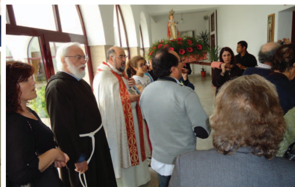
Procissão em honra do Menino Jesus de Praga